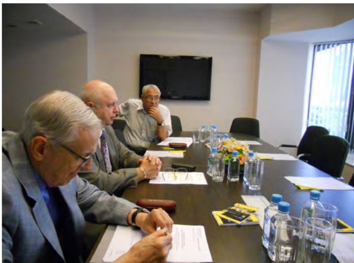
Фото: некоторые моменты заседания